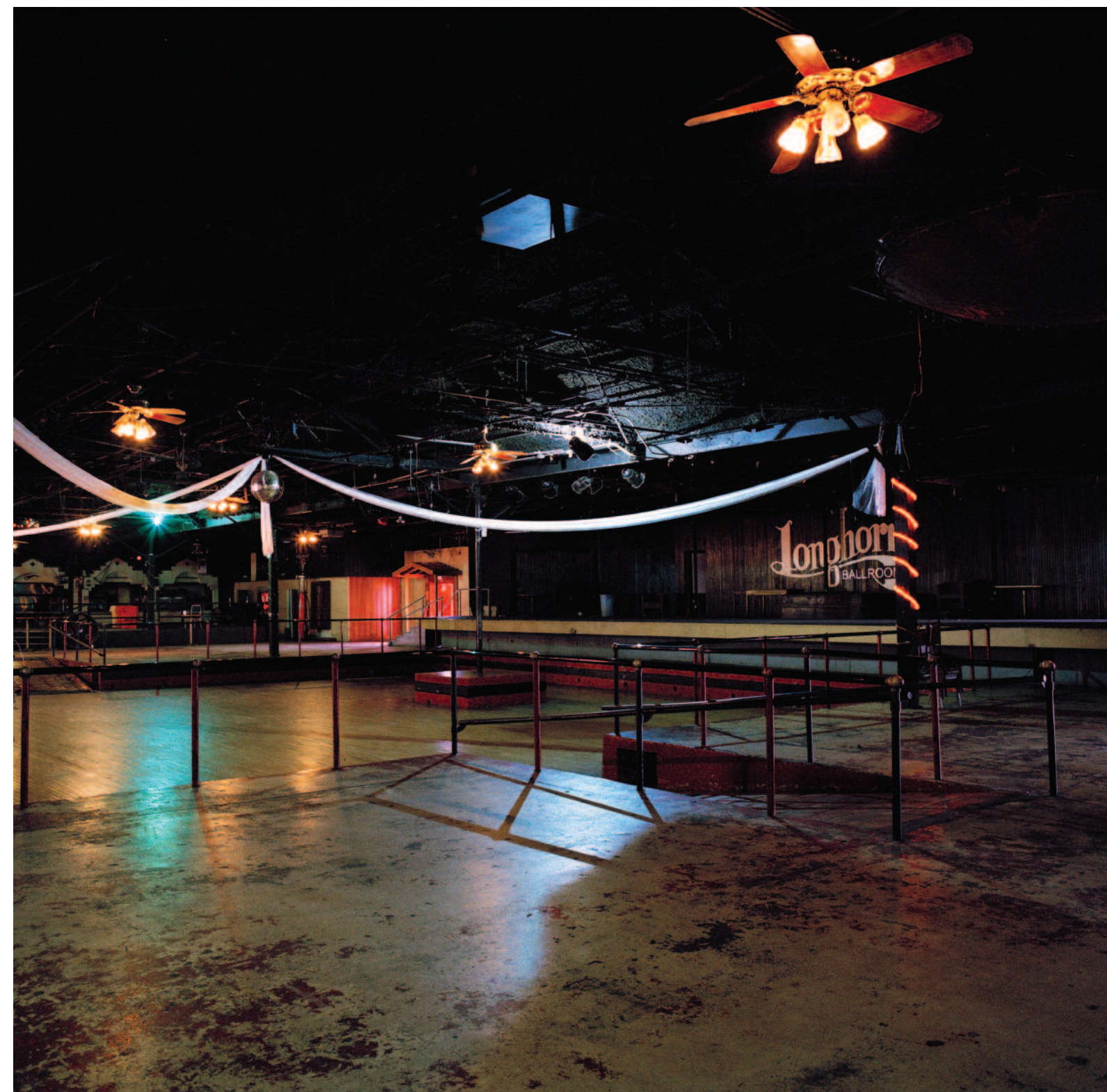
LONGHORN BALLROOM, DALLAS, TX, JANUARY 11, 2013

• Site : www.rhonabitner.com • Expositions : Blondeau & Cie., Genève (23/03 - 29/04/2017) Fondation Bru, Palazzetto Bru-Zane, Venise (mai-août 2017)