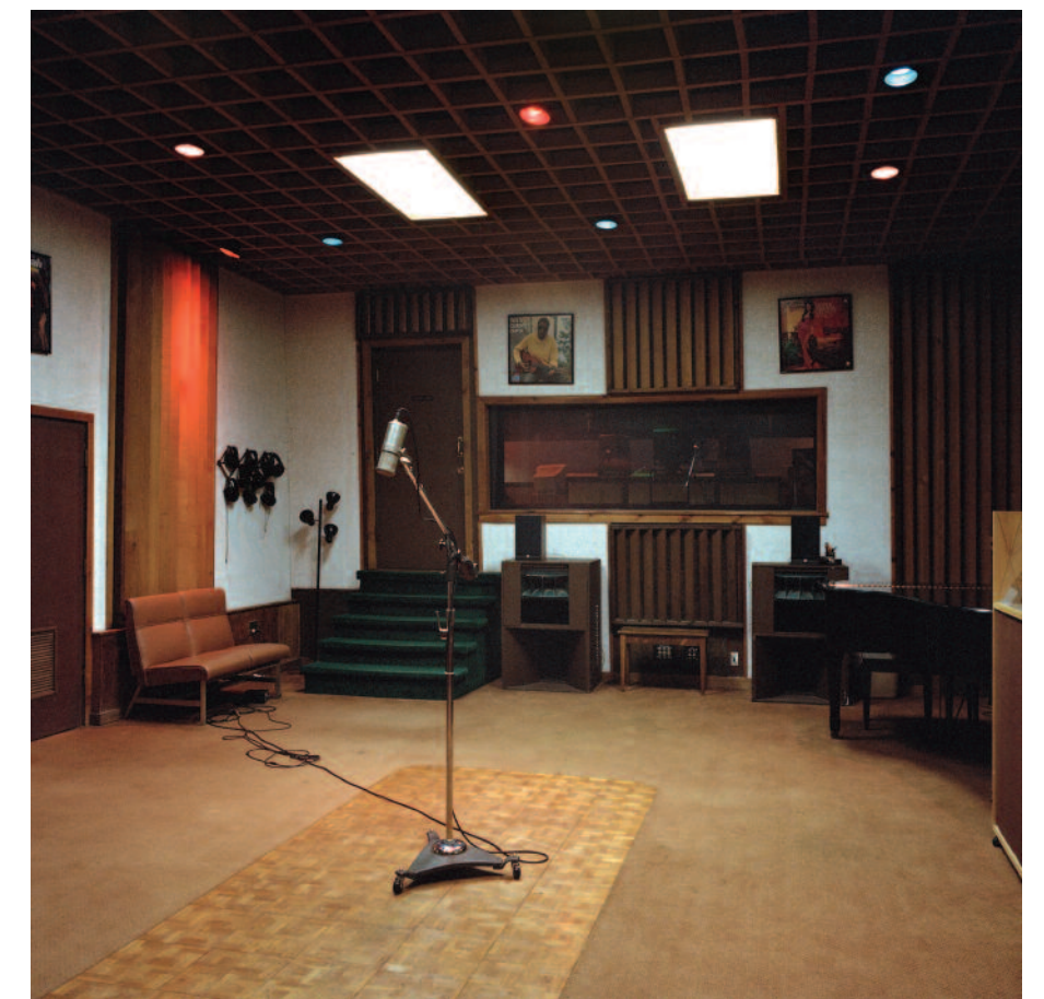
FAME STUDIOS, MUSCLE SHOALS, AL, MAY 8, 2008