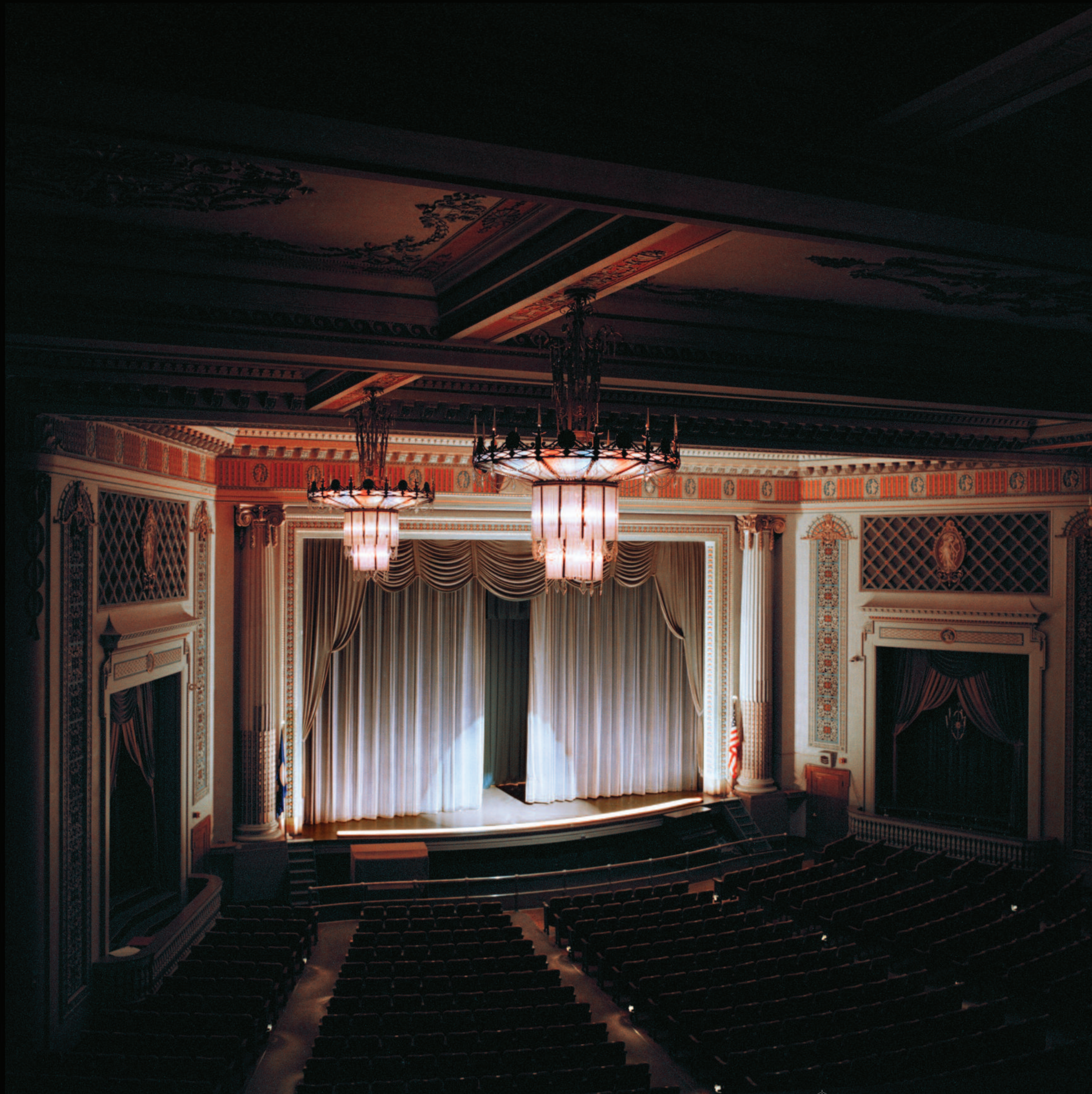
AUDITORIUM, HIBBING HIGH SCHOOL, HIBBING, MN, JULY 10, 2006