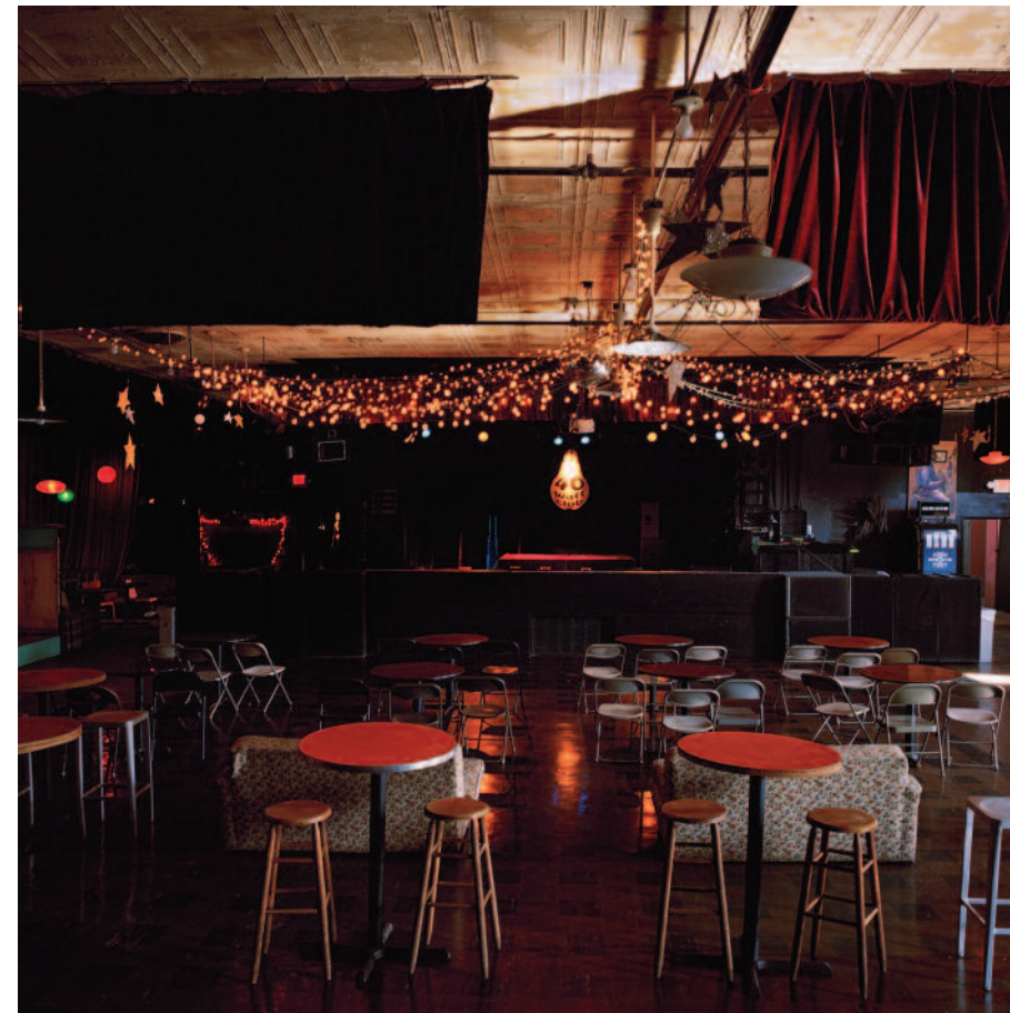
40 WATT CLUB, ATHENS, GA, JUNE 22, 2015