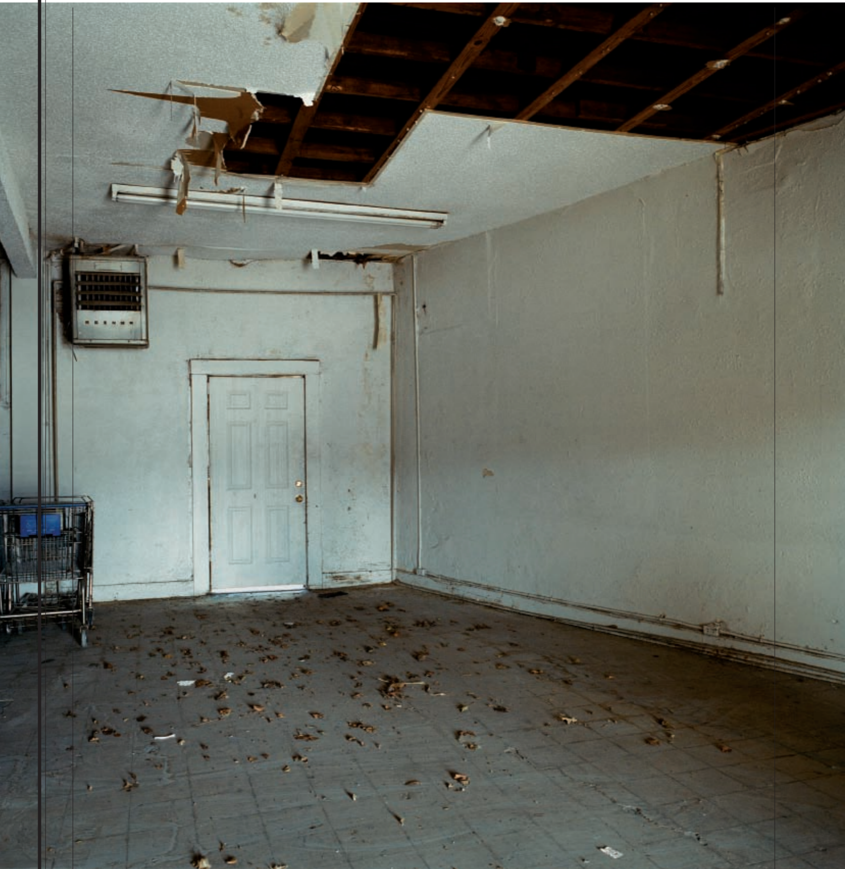
Tuxedo Junction (Birmingham, Alabama). "Tuxedo Junction es una canción escrita por Erskine Hawkins y Bill Johnson sobre este club de jazz y blues que formaba parte del Chitlin' Circuit [circuito de salas para el público afroamericano]. Glenn Miller grabó una de las versiones más conocidas, pero también la interpretaron Ella Fitzgerald o Duke Ellington. Se dice que en el sótano hubo un club punk en los 80".