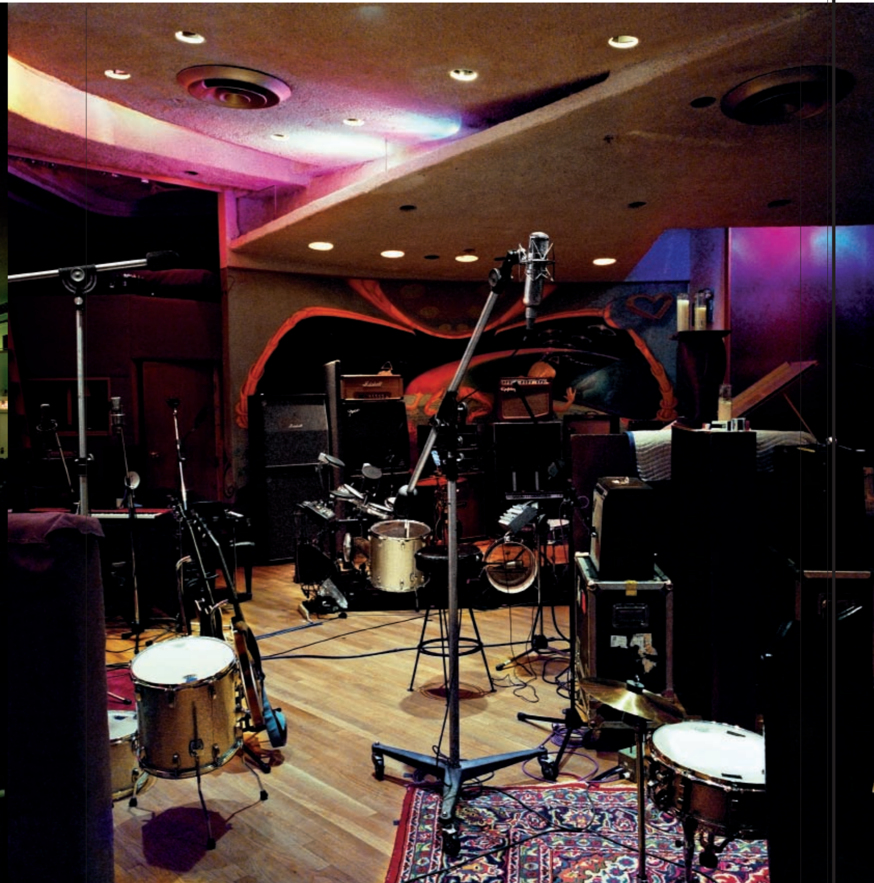
Electric Lady Studios (Nueva York). "Legendario estudio abierto por Jimi Hendrix en 1970. Hendrix hizo aquí su última grabación, conocida como Slow blues . Patti Smith grabó aquí en 1975 su álbum de debut, Horses , con John Cale. Led Zeppelin, David Bowie, The Clash, The Cars, AC/DC, The Rolling Stones, Pretenders y White Stripes son algunos de los que han grabado en este mítico espacio".