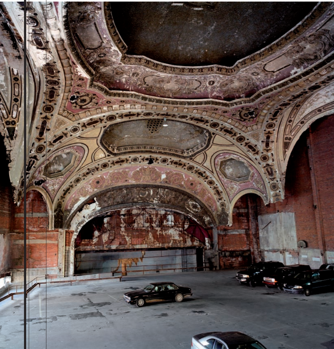
Michigan Theater (Detroit). "Uno de los cines más grandes del estado de Michigan. Se construyó en 1925 en el solar donde estuvo el pequeño garaje en el que Henry Ford hizo su primer automóvil. Fue sala de conciertos durante los 50 y 60 y algunas escenas de 8 millas [la película de Eminem] fueron rodadas aquí. Actualmente es un parking".

POR Beatriz G. Aranda