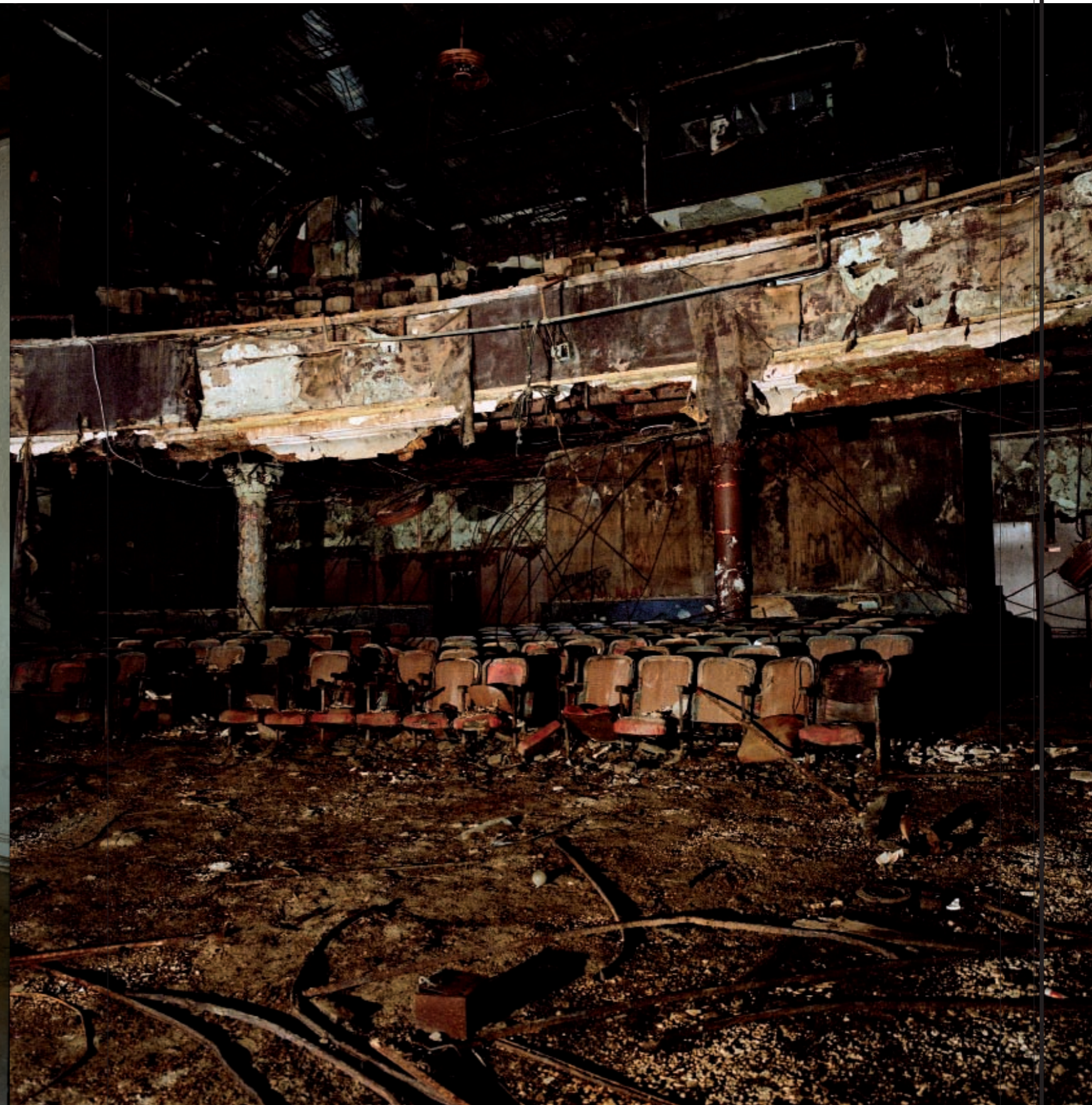
Howard Theatre (Washington DC). "Abrió en 1910. Fue un conocido teatro afroamericano del Chitlin' Circuit que programó a algunos de los grandes músicos negros de la primera mitad del siglo XX. Duke Ellington, Billy Eckstine y Ella Fitzgerald empezaron en concursos de aficionados aquí. Actualmente está en proceso de rehabilitación para volver a abrir como teatro".