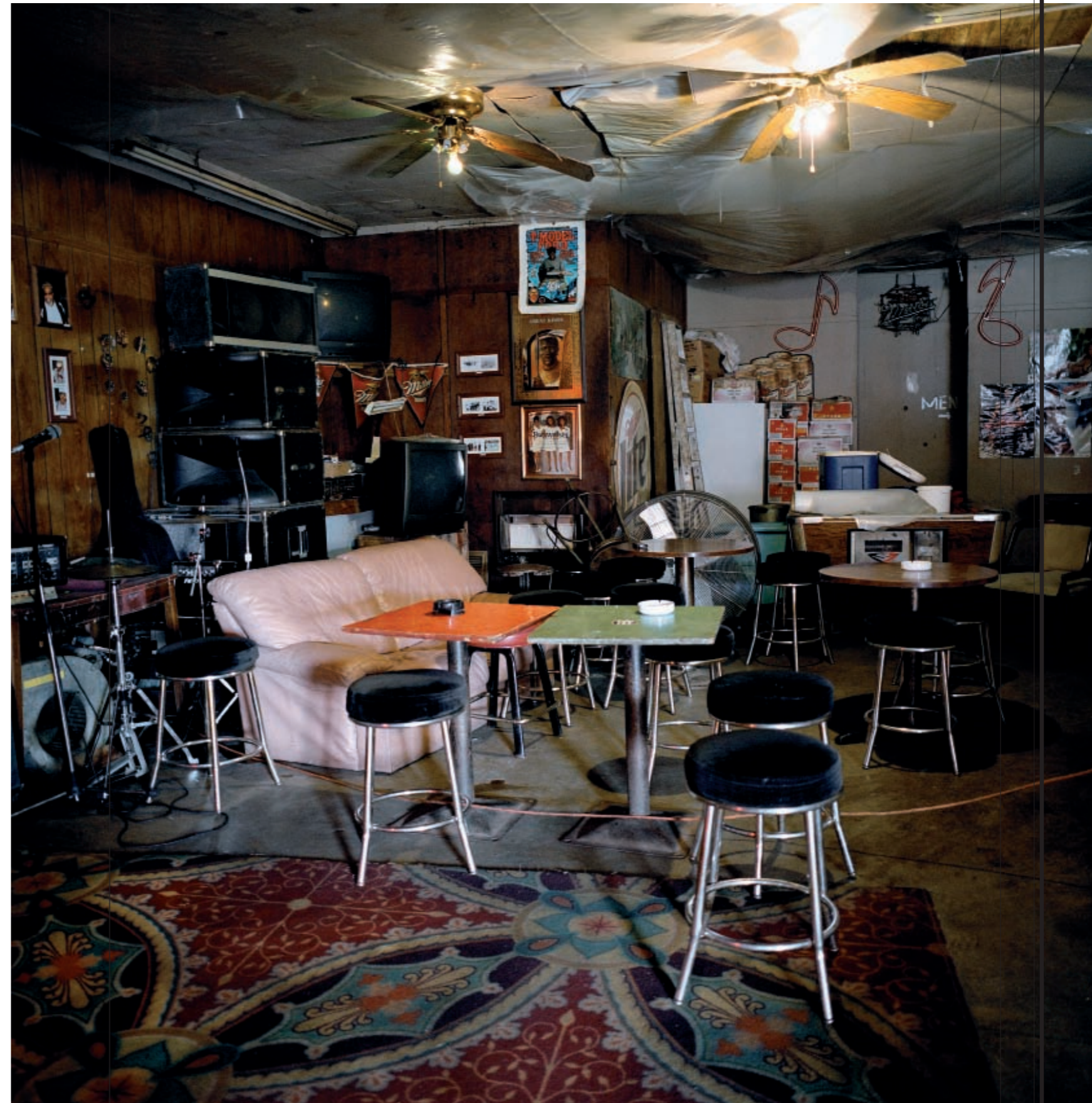
Red's Lounge (Clarksdale, Misisipi). "Uno de los últimos auténticos juke joints [bares rurales semicaseros de la población negra de los estados del Sur] del delta del Misisipi. Clarksdale y el delta del Misisipi están considerados como la cuna del blues. Aún funciona".

Manejando la objetividad a su antojo pero colocando siempre la cámara a escalas humanas (ni pájaros ni sometimientos: Rhona juega a ser siempre "una mera registradora de imágenes"), los lugares, estáticos, quedan en manos de su Mamiya japonesa de medio formato inmortalizados bajo el aura del recuerdo, de la imaginación y de la fe, mutando lo inocuo en algo lleno de significado: "No creo que el rock haya sido fagocitado por del capitalismo. El rock sigue evolucionando mientras los cambios sociales presentan al músico, poeta o artista retos y oportunidades para actuar y reaccionar. La música vivirá siempre, es su naturaleza lo que cambia con los tiempos". De repente, que el proyecto Listen naciera de una desaparición adquiere un pleno sentido: Rhona entiende como reto, como oportunidad, todo lo que sucede, también el cierre de un club o el exceso de presencias amateurs en la fotografía digital: "Las imágenes que toma la gente son parte de un todo", sugiere. En las suyas, si uno se concentra, hasta se puede oír un estrepitoso riff de fondo.