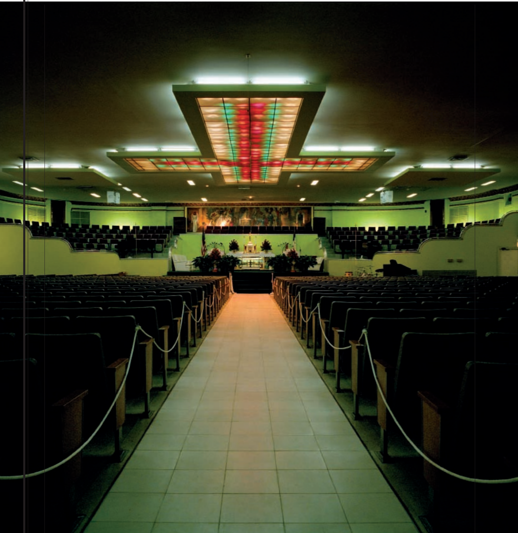
First Church of Deliverance (Chicago). "Con la instalación, en 1939, de un nuevo órgano eléctrico Hammond, el coro de gospel de esta iglesia se hizo muy popular. Es el lugar desde el cual se emitieron los primeros programas de radio de gospel y la primera iglesia negra en aparecer en la televisión estadounidense. Muchos estándares de este catártico género tuvieron su origen aquí".